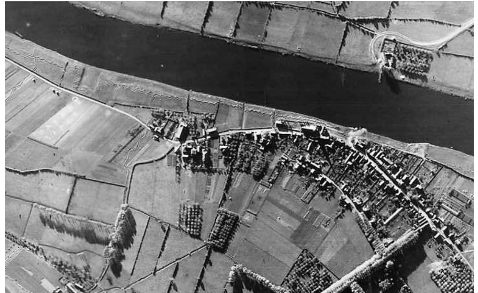
Loopgraven langs de Maas in oktober 1944.