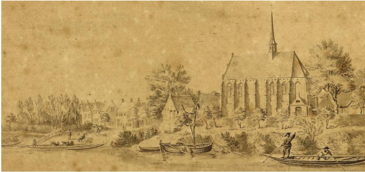
Tekening door Jan de Beijer (1737). De kerk heeft dan nog een één beukig koor én schip.