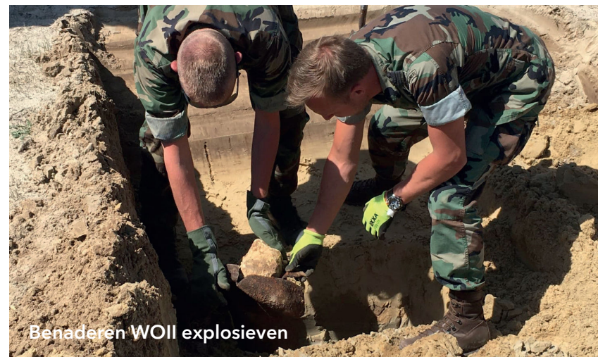
Benaderen WOII explosieven