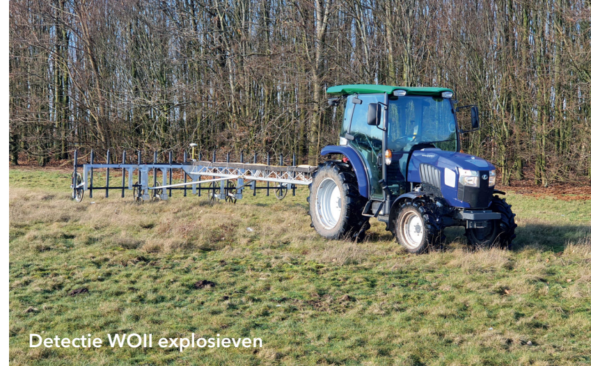
Detectie WOII explosieven