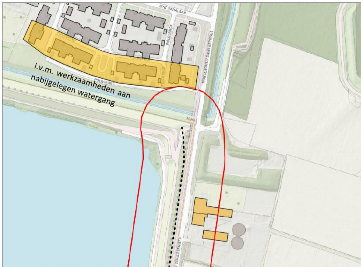
Overzicht bouwkundige opnames Polderhof en Mgr. Savelbergweg (rode lijn = 50m zone van damwand, de stippellijn = indicatie damwand)