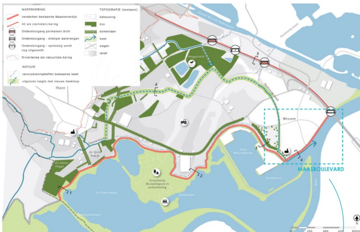
Figuur 1: Projectgebied