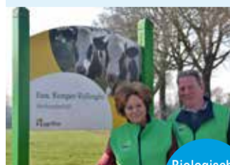
Biologische producten proeven