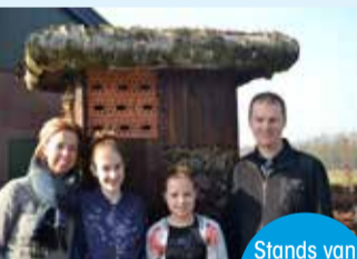
Stands van o.a. natuurorganisaties

Deelname o.v.v. wagens dreiging vogelgriep