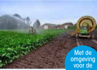
Met de omgeving voor de omgeving