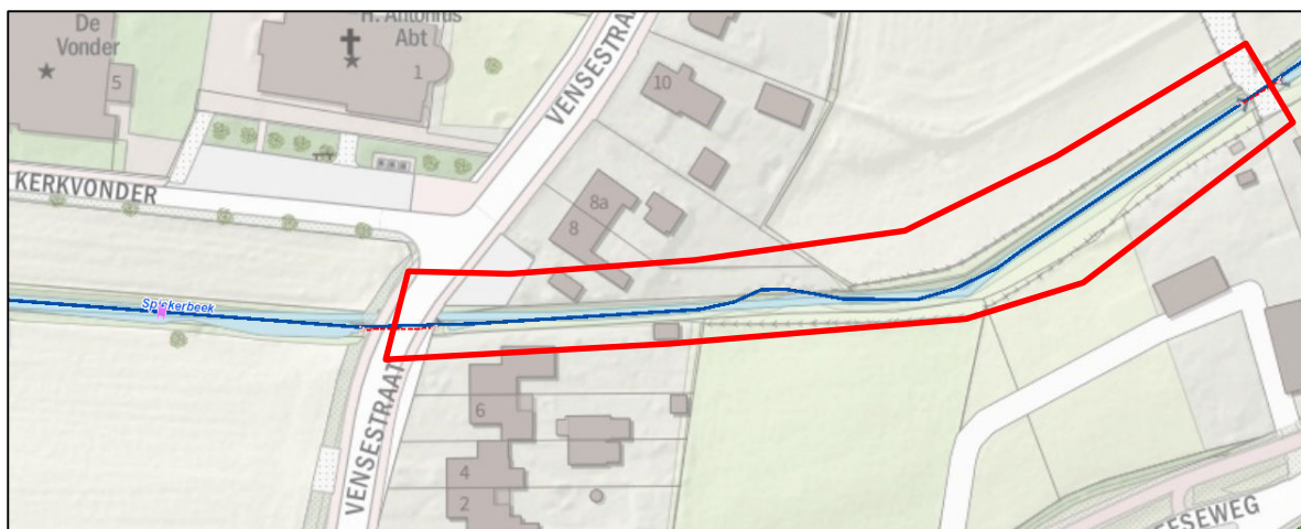
Figuur 2 Spiekerbeek ten oosten van de Vensestraat