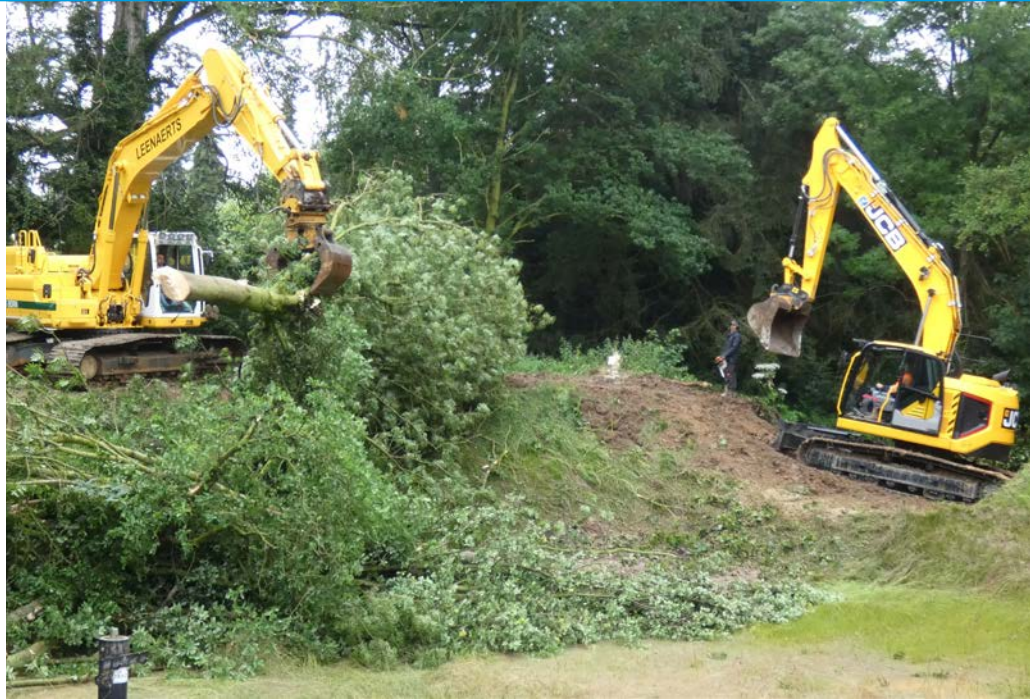
Herstelwerkzaamheden aan de waterbuffer.

Deze buffer was hiermee hersteld en de overlaat verbreed, maar de nieuwe stabiliteit was onbekend. Daarom heeft het waterschap de dammen uitgebreid laten onderzoeken door Fugro. Het bijzondere aan deze dammen is dat ze veelal opgebouwd zijn uit lokaal aanwezige 'silt', in Zuid-Limburg beter bekend als löss. Kenmerkend voor löss is dat het lastig kan worden verwerkt als het nat is en dat het makkelijk erodeert door stromend water. Bij goede behandeling en selectie op lutum- en zandgehalte kunnen er in de praktijk echter stevige grondlichamen van worden gemaakt. Fugro heeft een grondonderzoek uitgevoerd in de dammen bestaande uit boringen met monsternamen. In de boorgaten zijn peilbuizen afgesteld om de verzadiging van de dammen te meten tijdens het vollopen van het bassin. Op de grondmonsters is geotechnisch laboratoriumonderzoek uitgevoerd. Daarbij is uitgebreid gekeken naar de sterkte van de löss. Dit is enerzijds gedaan door tien triaxiaalproeven uit te voeren op ongeroerde lössmonsters uit de dammen. Anderzijds is beschouwd in hoeverre het beter verdichten van de löss tot een grotere sterkte zou kunnen leiden. De lössmonsters zijn daarvoor kunstmatig verdicht in een Proctorapparaat tot 100 procent dichtheid bij het in de grond aanwezige watergehalte. Op deze verdichte monsters zijn vervolgens ook tien triaxiaalproeven uitgevoerd.