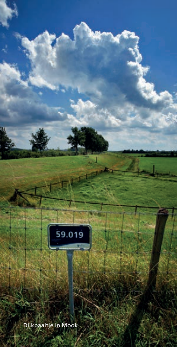
Dijkpaaltje in Mook